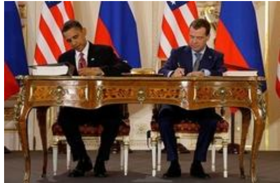
Ondertekening in Praag van het start-verdrag.

Niettemin merkt de Nezavisimaja Gazeta op dat het fundament van vriendschappelijke verhoudingen tussen landen in het geval van Amerika en Rusland ontbreekt: hechte economische betrekkingen. Verder vreest de krant dat de wapenwedloop weer een herstart kan krijgen als in Amerika bijvoorbeeld een Republikeinse president de Democraat Obama opvolgt of als de intercontinentale raketten in Amerika worden voorzien van een nieuwe generatie niet-nucleaire ladingen.