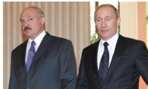
Aleksandr Loekasjenko en Vladimir Poetin

in de afbetaling van Russische gasleveranties (een bedrag van 450 miljoen dollar in 2007), voerde