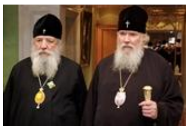
De laatste foto van Lavr (links) en Aleksii II (rechts) samen.

In hoeverre de eerste bepaling uit de Acte realiteit zal worden, moet de toekomst uitwijzen, want veel leden van de buitenlandse kerk staan kritisch tegenover de Russisch-orthodoxe kerk vanwege zijn samenwerking met de wereldlijke machthebbers, of het nu de voormalige communisten waren of het postcommunistische regime van Vladimir Poetin.