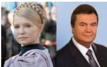
Oranje-premier Timosjenko en de huidige president Janoekovitsj. Foto uit 2004.

presidenten van Rusland en Oekraïne, Dmitri Medvedev en Viktor Janoekovitsj, op 21 april 2010 in Charkov afsloten: de verlenging van het huurcontract van de Russische Zwarte Zeevloot in de havenstad Sevastopol op de Krim vanaf 2017 met dertig jaar in ruil voor een prijsverlaging van 30 procent voor de levering van Russisch gas.