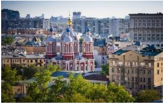
Contrasten in Moskou.

Moskou onder ex-burgemeester Joeri Loezjkov was dit het geval, waardoor veel historische panden uit het stadsbeeld verdwenen, zoals het militaire warenhuis Vojentorg.