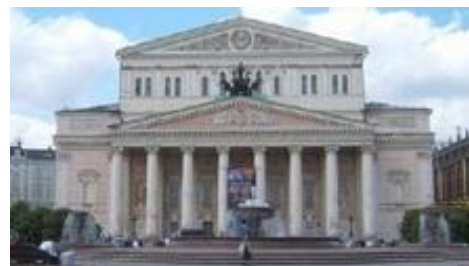
Bolsjoj theater in Moskou