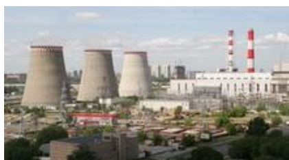
Het Moskouse energiebedrijf Mosenergo is onderdeel van gasmonopolist Gazprom.

economie een flinke groei. De mondiale kredietcrisis die in 2008 uitbrak liet echter zien dat het fundament van deze groei wankel was: 'De "vette jaren" werden verspild. In plaats van met het overwinnen van de energie-afhankelijkheid was de staat bezig met het "opeten" van de olie-inkomsten.' In het tweede kwartaal van 2009 kromp