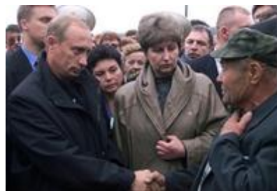
Poetin ontmoet de familie van de Koersk-bemanning.

Maar Poetin herpakte zich snel. Hij toog naar de militaire havenstad Moermansk om de nabestaanden van de omgekomen marinemensen alsnog te troosten en beloofde hen dat de atoomonderzeeër met de omgekomen bemanningsleden zou worden gelicht. Met behulp van het ingehuurd Nederlandse bergingsbedrijf Mammut deed hij zijn belofte gestand. Toen vormde zich ook Poetins kaderpolitiek: loyaliteit betrachten aan de hoogste functionarissen die ook loyaliteit betrachten aan zijn bewind.